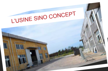
L'USINE SINO CONCEPT